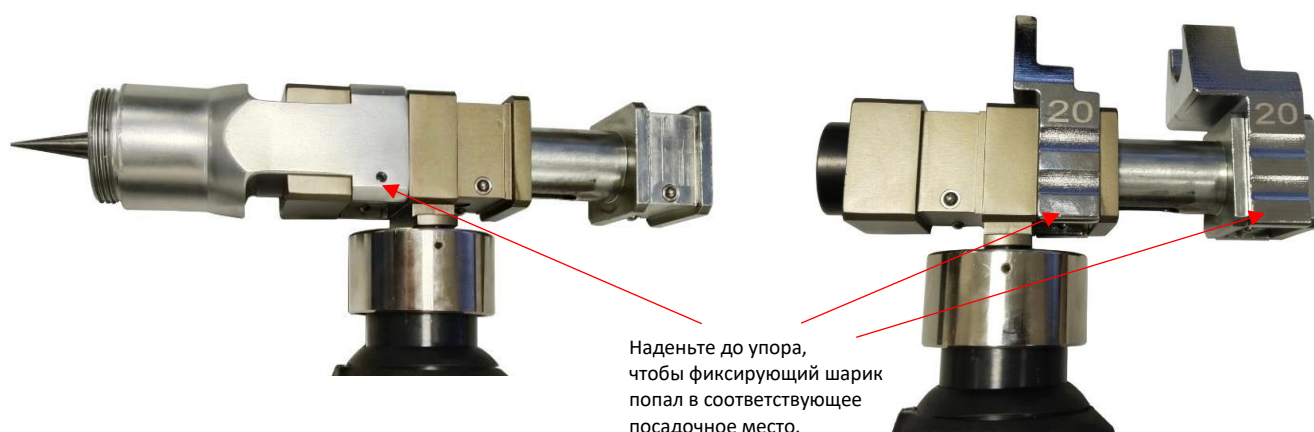
Рис. 1 Правильная установка расширительного адаптера и запрессовочных тисков на аксиальном прессе

Внимание! Во избежание поломки расширительного адаптера и запрессовочных тисков, убедитесь, что они установлены правильно на аксиальном прессе (Рис.1). Они должны быть зафиксированы в соответствующих пазах при помощи утапливаемых стальных шариков. Неправильная установка ведет к деформации и последующей поломке расширительного адаптера и запрессовочных тисков.